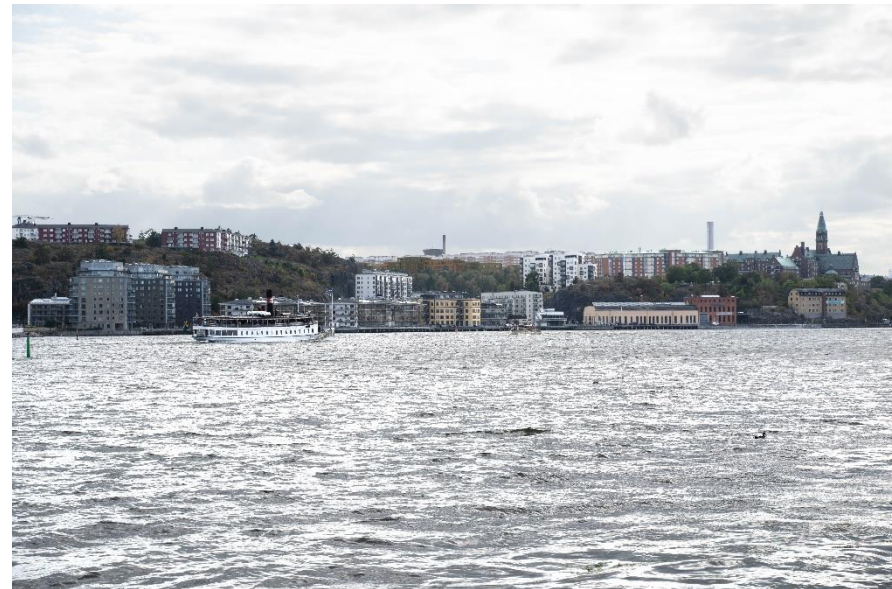
Vy från Djurgården vid Manilla mot planområdet och den föreslagna bebyggelsen.

Området vid Henriksdalsbacken ingår i planprogrammet för Henriksdal från 2018, men exploateringsgraden i planförslaget är betydligt lägre och bebyggelseområdet mindre än i programmet.