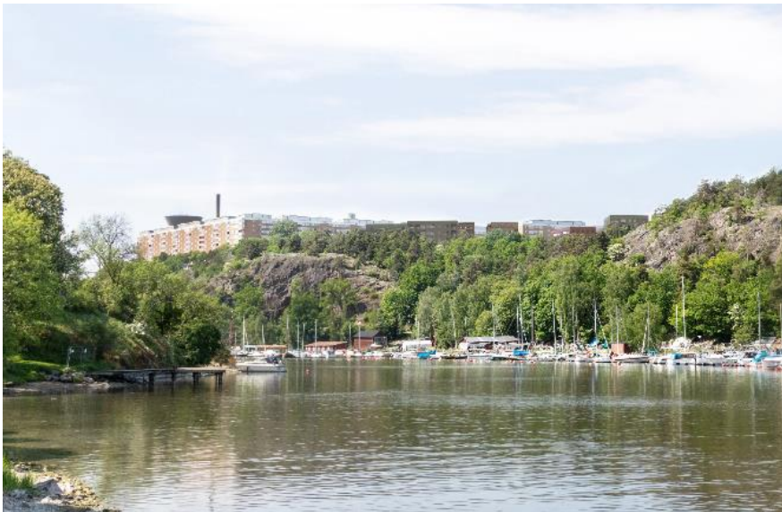
Vy mot planområdet från stranden vid Svindersviks gård.

Lämpliga fasadmateriäl är t ex träpanel, puts eller tegel. För att bebyggelsen ska samspela med landskapet och underordna sig Henriksdalsringen föreslås att färgsättningen ska utgå ifrån kulörerna i den omgivande skärgårdsnaturen där dovt grå, gröna, röda och gula kulörer dominerar. Undantaget är det sydvästra klimatkvarteret som föreslås utformas med fasader av värmebehandlat trä i olika grader av värmebehandling.