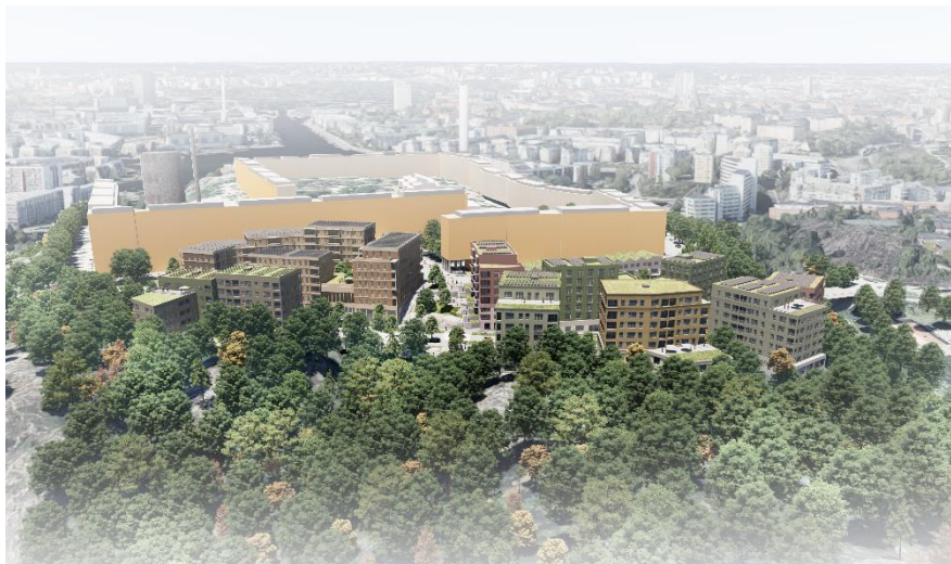
Illustration med föreslagna kulörer, fågelperspektiv från öster.

Området vid Henriksdalsbacken utpekades som ett möjligt område för ny bebyggelse i planprogrammet för Henriksdal från 2018. Jämfört med planprogrammet har exploateringsnivån sänkts från programmets ca 500 bostäder till ca 400 bostäder. Bebyggelsens fotavtryck har minskats påtagligt på den östra sidan och planstrukturen har ändrats från stadsmässiga slutna kvarter till en mer terränganpassad struktur som möjliggör släpp mellan bebyggelsen och mer sparad naturmark.