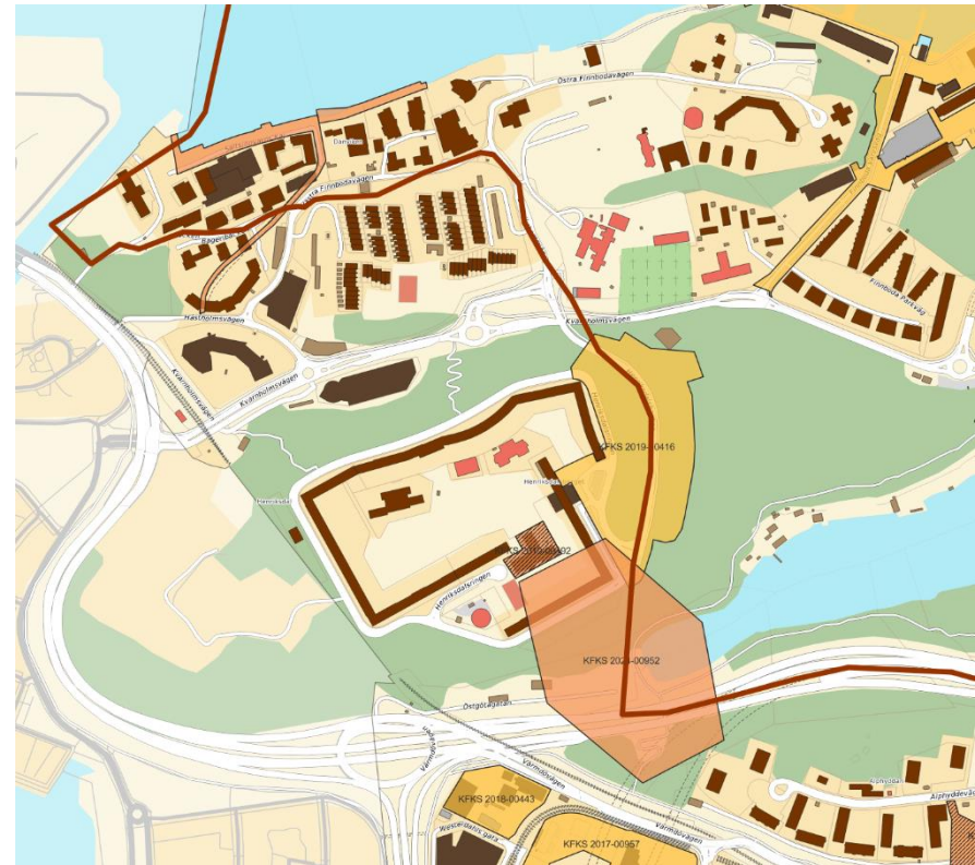
Figur 4. Karta som visar angränsningen av planområdet.

planprojektet har därför varit att den nya bebyggelsen ska underordna sig Henriksdalsberget i höjder och volymer och gestaltas så att läsbarheten inte påverkas negativt. Dessa anpassningar har samtidigt bidragit att påtagligt minska påverkan på riksintresset och planförslagets kumulativa effekter.