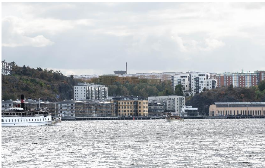
Närmare vy från Djurgården vid Manilla mot planområdet och den föreslagna bebyggelsen.