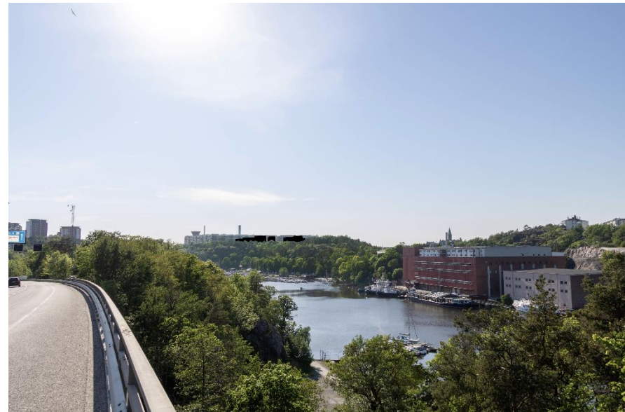
Vy mot planområdet från Värmdöleden. Den tillkommande bebyggelsen är markerad som en svart silhuett.

För att den nya bebyggelsen ska underordna sig Henriksdalsringen har stor vikt även lagts på gestaltning och färgsättning. Bebyggelsen har utformats med ett lugnt uttryck, med balans mellan horisontalitet och vertikalitet. Fasadmaterialet och färgsättningen ska bidra till det lugna uttrycket.